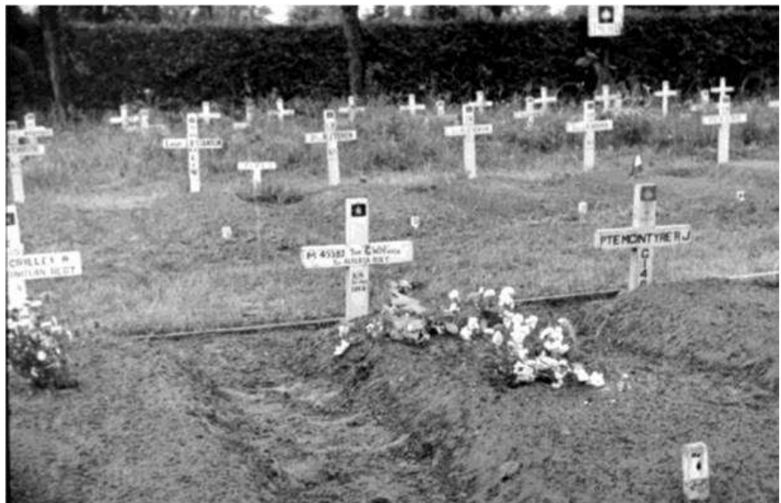
Strip#25 – n° 008

Roy sneuvelt op 5 februari 1945 in Nederland. Hij is twintig jaar oud. Hij sterft in dienst van het gepantserde Lake Superior Regiment, en wordt eerst begraven op de tijdelijke begraafplaats in 's-Hertogenbosch.